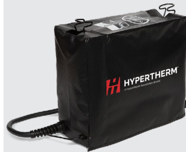
Housses de protection contre la poussière pour le système