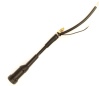
Euro Adapter for MinarcMig

L'adaptateur Euro pour MinarcMig vous offre un tout autre niveau de connectivité.