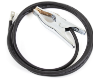
Earth return cable 25 mm 2 , 3 m

Le MST 400 est une unité de transport à deux roues recommandée pour les bouteilles de gaz de petites tailles.