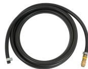
Shielding gas hose 4.5 m